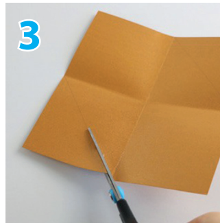
3 Markierte Dreiecke und ein Quadrat abschneiden.