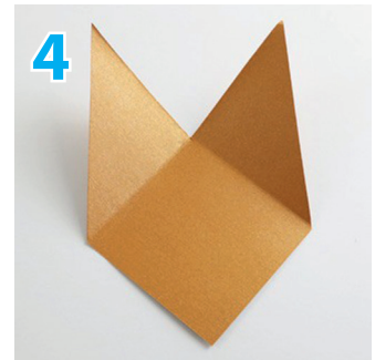
4 Danach sieht es so aus. Jetzt wird gefaltet ...