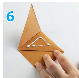
6 ... einstreichen und das zweite Dreieck ankleben.