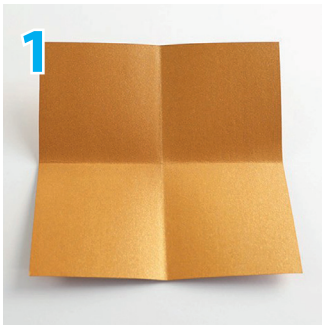
1 Papier-Quadrat zuerst längs und quer falten

Wie wird's gemacht? Der Basistyp ist schnell gemacht – die Gestaltung braucht Fantasie.