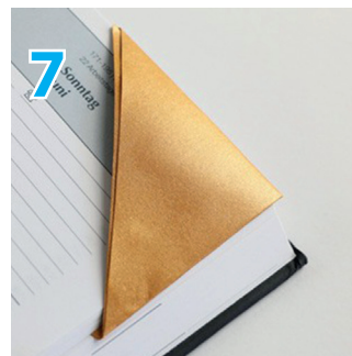
7 Der Grundtyp der Lese-zeichenecke ist fertig ...

Beim Gestalten des Lesezeichens sind keine Grenzen gesetzt. Wir haben mal ein paar Beispiele als Ideenhilfe gesammelt. Und wir haben ein paar Vorlagen zum Ausmalen vorbereitet.